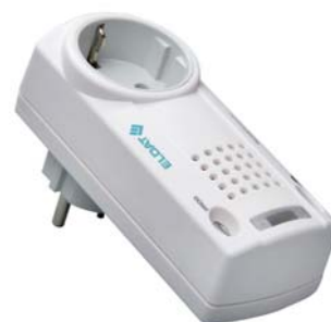
Steckdosen-Empfänger mit akustischen / optischen Alarm