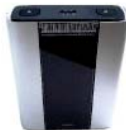
6-Kanal-Empfänger mit akustischen / optischen Alarm