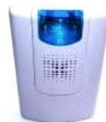
1-Kanal-Empfänger mit akustischen / optischen Alarm