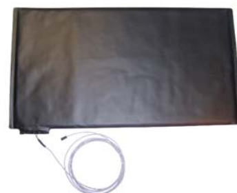
Trittmatte mit Kabel

Selbstverständlich können die Komponenten auch individuell für besondere Anwendungen zusammengestellt werden. Zu den gängigen Anwendungen zählen: