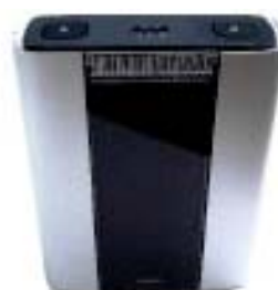
6-Kanal-Empfänger mit akustischen / optischen Alarm